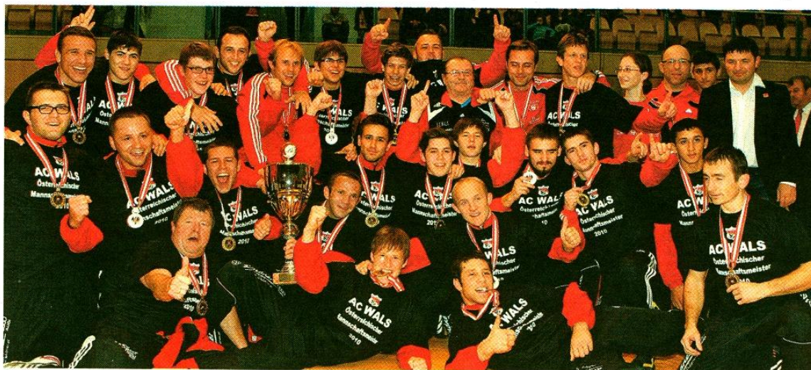
Großer Jubel beim A.C. Wals: Die Walser Ringer konnten ihren 45. Meistertitel in der Bundesliga fixieren.