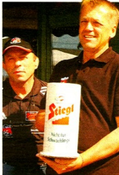
Nichts für Schwächlinge: Die „Spielchen“ der Walser Ringer.