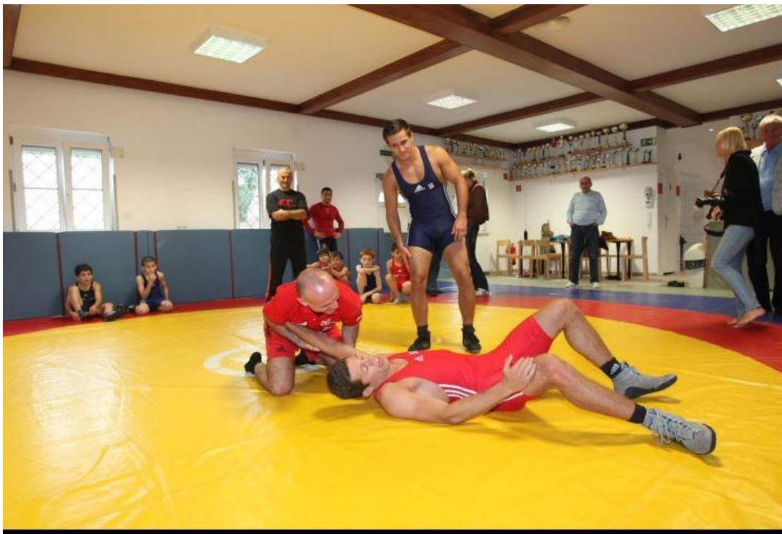
Am Ende lag dieser auf der Matte