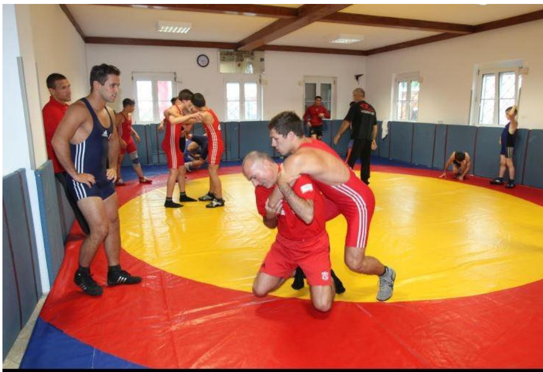
Klug packte fest zu und...