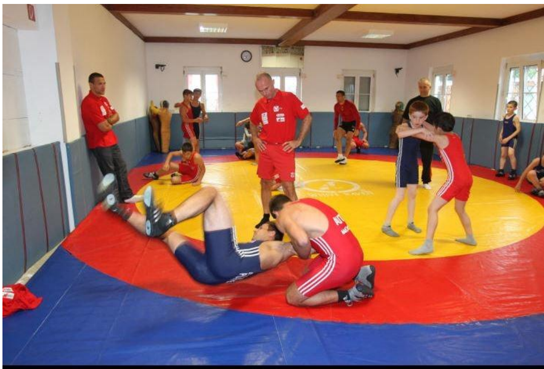
Zunächst schaute der Minister genau zu