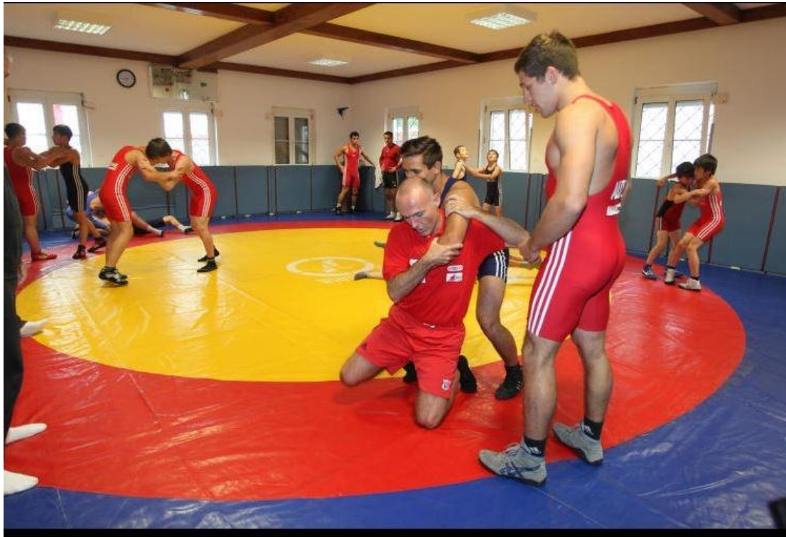
Dann schritt er selbst zur Tat